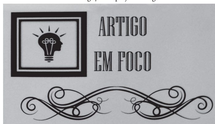
FIGURA 1 – divulgação do projeto “Artigo em Foco”

Na comunicação do projeto, procurou usar cores sóbrias e pouco ou nenhum ordenamento. O objetivo aqui era chamar a atenção do voluntário com uma publicidade diferente da utilizada habitualmente pelo padrão institucional e pelo qual está acostumado. Ao mesmo tempo pudesse remeter a ideia de estar lendo um impresso antigo devido às escolhas das letras, ativando inconscientemente a sua vontade de procurar livros ou escrever algo.