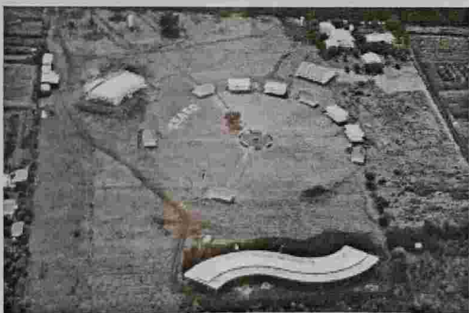
Foto aérea do CEAEC com os laboratórios ao longo do círculo central

O projeto global de instalação dos Laboratórios Conscienciais no CEAEC inclui cerca de 50 laboratórios, dos quais 9 já se encontravam em funcionamento ao final de 1998. A seguir, fornece-se uma breve descrição de cada um dos laboratórios em funcionamento, considerando seus objetivos, técnicas aplicadas, material de apoio e duração do experimento.